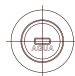
planta - sem escala

ESTE DOCUMENTO É PROPRIEDADE DOS SMAS MAIA E A SUA UTILIZAÇÃO, TOTAL OU PARCIAL, DEVE SER COMUNICADA E EXPRESSAMENTE AUTORIZADA